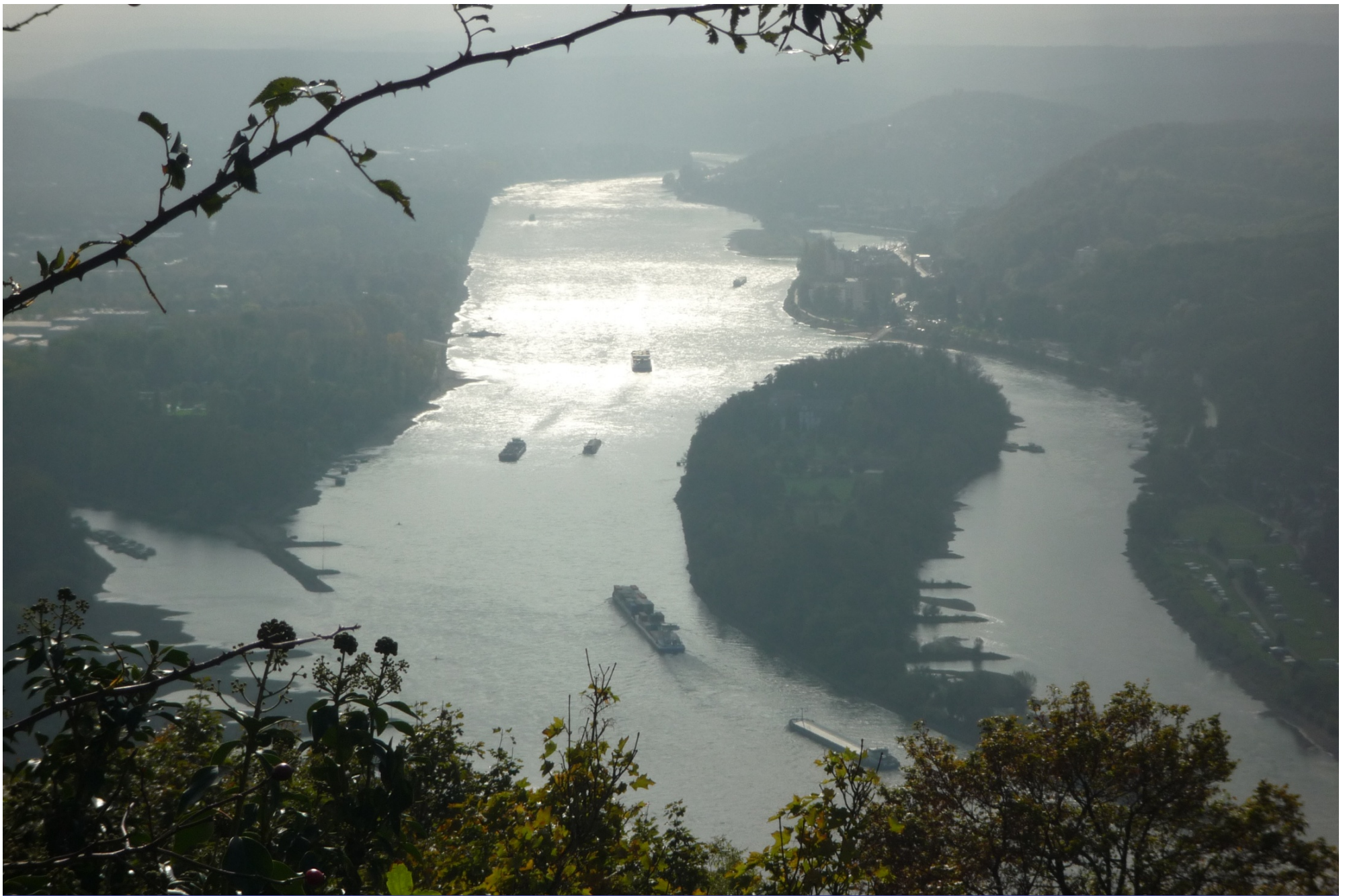
De Rijn stroomopwaarts gezien vanaf de Drachenfels